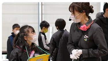
案内スタッフへ質問