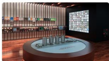
味の素グループうま味体験館