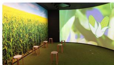
「クノール®」スープ工場