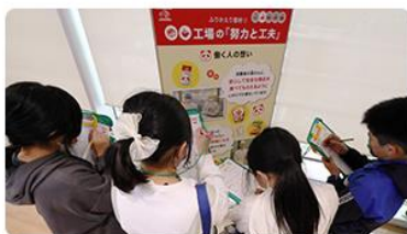
パネルを使った取材