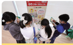
パネルを使った取材