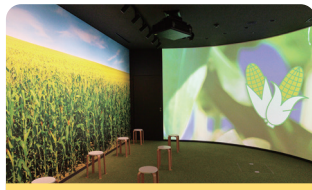
「クノール®」スープ工場