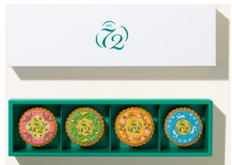
Atr.72™ Flowering Mooncake (Gift Box)

シンガポールには、9月17日の「中秋節」に美しい月を愛でながら家族の幸せを願って月餅を贈り合う風習があります。大切な人を想うとき、相手のことだけでなく、地球環境にまで心を配った贈り物は人と人との温かなつながりを作り出します。「Atr.72™ Flowering Mooncake」は、クッキーサンド形状の月餅で、秋の旬をイメージした4種のフレーバー(柚子、京都宇治抹茶、ラズベリー、ブラックカラント)のギモーヴ ※4 を、プラナカン ※5 柄の華やかなデコレーションクッキーでサンドしています。クッキーの味わいにコクを付与するためにバターの一部を「Solein®」で代用、ギモーヴには動物性ゼラチンではなく寒天を使用、白砂糖は最小限に抑えてミネラルやオリゴ糖を含むてんさい糖を使い、素材の甘みが引き立つよう沖縄産海塩をわずかに加えるなど、日本の有名パティシエによるレシピ監修のもと、おいしさだけでなく、健康や地球環境にも配慮した工夫がなされています。