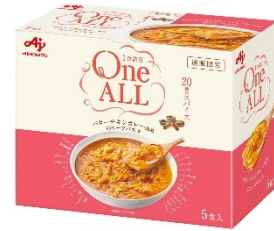
＜バターチキンカレー風味のスープパスタ＞

2022年の完全栄養食(1食で必要な栄養素がバランスよく摂れる食品)の国内市場規模は、食事に対する健康意識と簡便性の高い食品需要の高まりから、約144億円まで拡大しています(下図参照)。