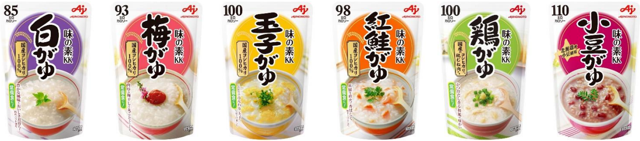
「味の素kkおかゆ」シリーズ(全6品種)