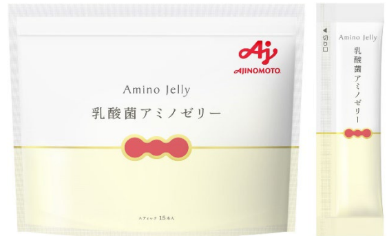
「乳酸菌アミノゼリー」 15本入り(約15日分)

乳酸菌入り食品市場は約4,000億円、年平均市場成長率は3% ※2 と規模・成長性ともに有望な市場と捉えられており、乳酸菌の菌種や菌数を訴求する製品が多く存在します。一方、乳酸菌やビフィズス菌をはじめとする大腸内の善玉菌には人体同様、アミノ酸と糖質が栄養源として欠かせません。従来、オリゴ糖などを活用して糖質を大腸まで届けることはできましたが、アミノ酸を大腸に届けることに関しては、実用的な知見はありませんでした。このような課題に対し当社は、腸内の善玉菌まで届くアミノ酸源の「ポリグルタミン酸」と糖質源の「ガラクトオリゴ糖」を組み合わせたダブルの栄養の“届くチカラ”を食品に活用するという新しい技術を開発しました。この技術と乳酸菌をかけあわせ、乳酸菌の補給に加えて元来自身の腸内にいる善玉菌にダブルの栄養を届けるという当社独自の特長を有する「乳酸菌アミノゼリー」を発売します。