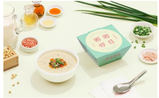
「粥粥好日」<鹹豆漿粥>

中華圏では一般的な、辛さが特徴の火鍋をお粥に。食欲をそそる一杯です。カロリーは236kcal[別添込]です。