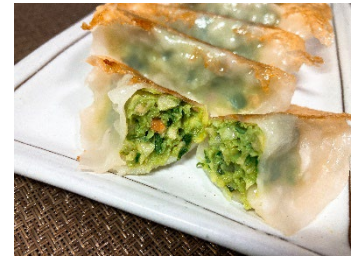
<エナジーギョーザ®> <コンディショニングギョーザ>