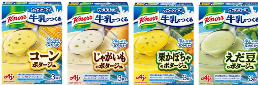
コーンポタージュ じゃがいものポタージュ 栗かぼちゃのポタージュ えだ豆のポタージュ