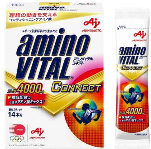
「アミノバイタル®CONNECT」 ＜14本入箱＞

日本代表選手団だけでなく、幅広い層のアスリートから一般の方までお使いいただけるよう、2021年10月8日(金)より一般発売します。