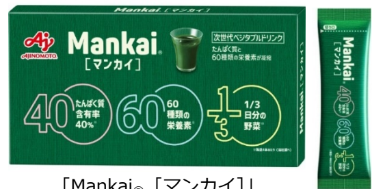
「Mankai ® [マンカイ]」 30本入り(約30日分)

※3) スティック1本当たり、厚生労働省が推進する「健康21」において1日分の野菜摂取目標量350gの1/3にあたる、約117g分の葉野菜マンカイ(ウォルフィア)を乾燥させた原料を使用しています。