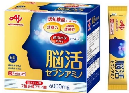
「脳活セブンアミノ」60本入り (約30日分)

日本では、超高齢社会を迎え、加齢に伴う認知機能の低下が大きな社会問題となっています。認知機能を維持・向上させることは生活の質の維持・向上に役立つとともに、医療や介護といった社会全体の負荷軽減の観点からも重要です。認知機能サポートサプリメントの国内市場規模は約170億円で ※5 、今後さらなる高齢化の進展により、市場規模がさらに拡大することが見込まれます。