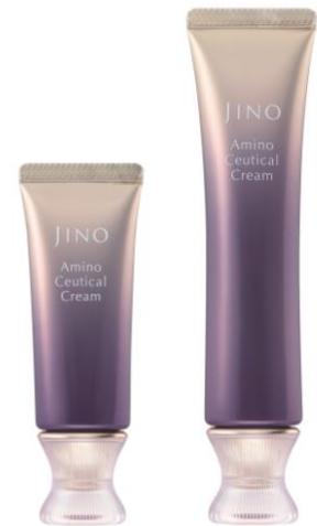
<アミノシューティカル クリーム> (20g、40g)