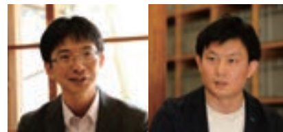
開発に携わった当社従業員

コロナ禍で食に求められる役割が変化・拡大する中、栄養・簡便さといった機能的価値に加えて、つながり・共感といった情緒的価値へのニーズが、さらに高まっています。