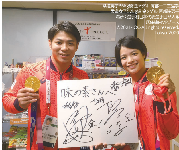
柔道男子66kg級 金メダル 阿部一二三選手 柔道女子52kg級 金メダル 阿部詩選手 場所：選手村日本代表選手団が入る 居住棟内VPブース

当社は、東京2020大会で得られた知見を活用し、全ての生活者の「食と栄養課題の解決」を図っていきます。