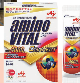
アミノバイタル® CONNECT (14本入り箱)

味の素(株)は、東京2020オリンピック・パラリンピックのオフィシャルパートナーです。(調味料、乾燥スープ、アミノ酸ベース顆粒、冷凍食品、コーヒー豆)