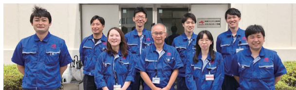
大賞を受賞した味の素ファインテクノ株式会社 研究開発部

ASVアワード受賞プロジェクトの詳細をご覧いただけます。 https://www.ajinomoto.co.jp/company/jp/aboutus/vision/asv-awards/