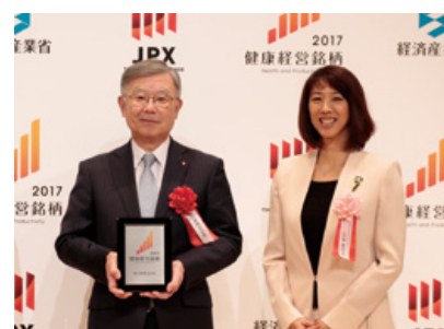
「健康経営銘柄2017」発表会の様子