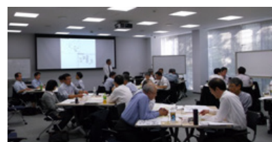
50代のキャリア研修の様子