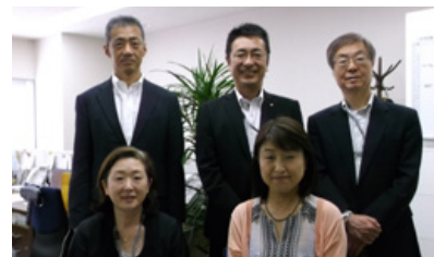
味の素(株)グローバル人事部キャリアサポートチームのカウンセラー

キャリア支援グループメンバーは、カウンセラー、ファイナンシャル・プランナー等の資格を取得し、コンサルタントとして信頼されるキャリア支援を目指しています。50代基幹職向けアップパーミドルキャリア研修では、社外キャリアカウンセラーとのフォロー面談も設け、インナー(社内)キャリアカウンセラー養成研修を行い、人事、事業所、関係会社の総務部門でのカウンセリング機能を備えた要員育成を図っています。