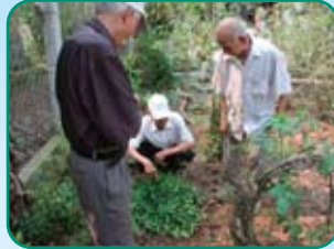
(ベトナム国立タイビン医科大学)