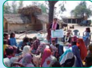
(アーシャ=アジアの農民と歩む会)