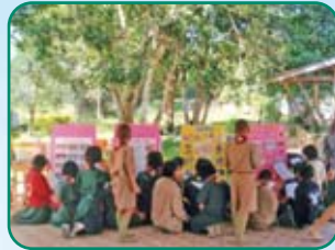
(地球市民ACTかながわ)